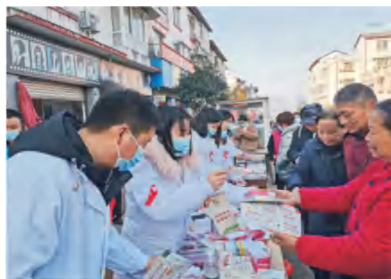
11月29日上午，广汉市疾控中心、市人民医院、市妇幼保健院的防治艾滋综合管理、抗病毒治疗、母婴阻断“三线”艾滋病防治专家参与市融媒体中心FM 97.4快乐帮帮帮电台节目录制，为公众解读艾滋病防治的相关政策、知识，为“艾”发声。