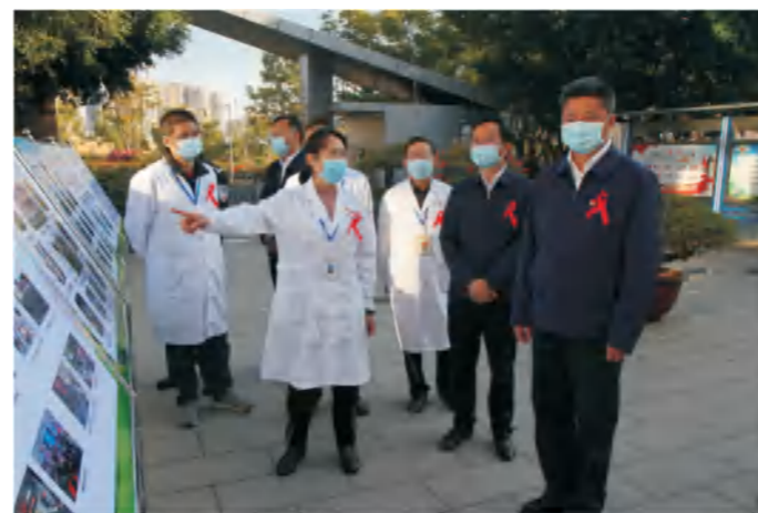
12月11日，攀枝花市政府虞平市长一行前往市疾控中心调研艾滋病防治工作，并慰问一线艾防工作人员。