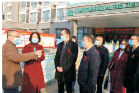
12月2日上午，德阳市政府副市长向赞一行到旌阳区泰山社区卫生服务中心（艾滋病抗病毒治疗点）调研艾滋病防治工作并慰问一线防艾工作人员。