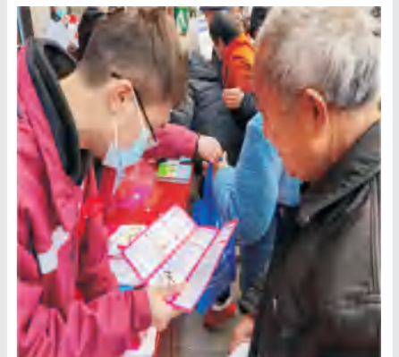
12月1日前后，通江县围绕“生命至上 终结艾滋 健康平等”和“防治性病、促进生殖健康”两个主题开展了一系列宣传活动。