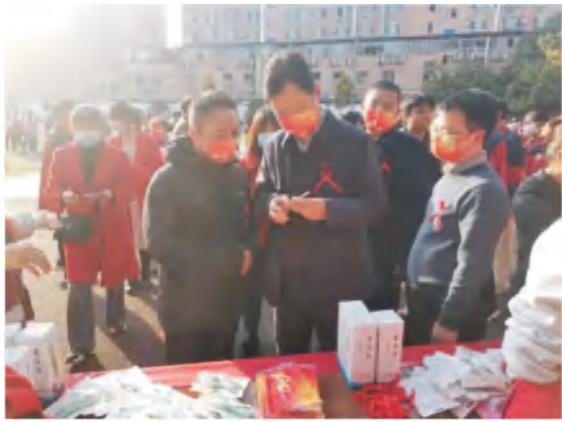
12月1日，资阳市疾控中心组织城区部分医疗卫生机构在高校开展艾滋病防治知识现场宣传活动。市卫健委主任高远、副主任文帮芬到活动现场慰问一线艾防工作人员。