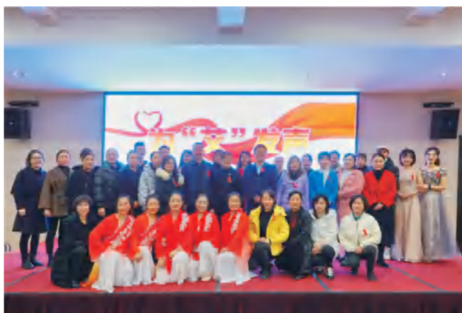
11月25日，蒲江县重大疾病预防工作委员会举办“为‘艾’发声”艾滋病健康教育技能大赛。评选出优秀防艾宣传队伍，为下一步精准有效开展防艾宣传提供有力支撑。