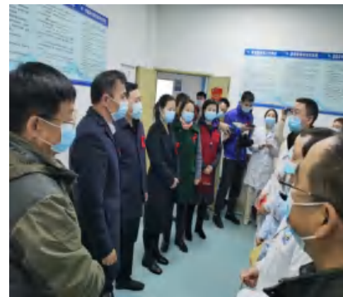
11月30日，广元市委副书记、市长邹自景调研市第一人民医院防艾工作，同时慰问艾防工作者。