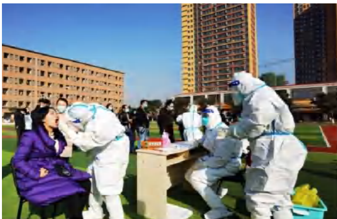
1月12日，资阳市疾控中心组织12名专业技术人员到四川希望汽车职业学院和资阳口腔职业学院采集部分师生咽拭子和外环境样本开展新冠肺炎病毒检验监测工作。