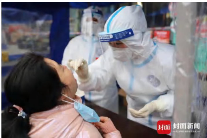
2月4日，四川省应对新冠肺炎疫情应急演练现场核酸采样点。