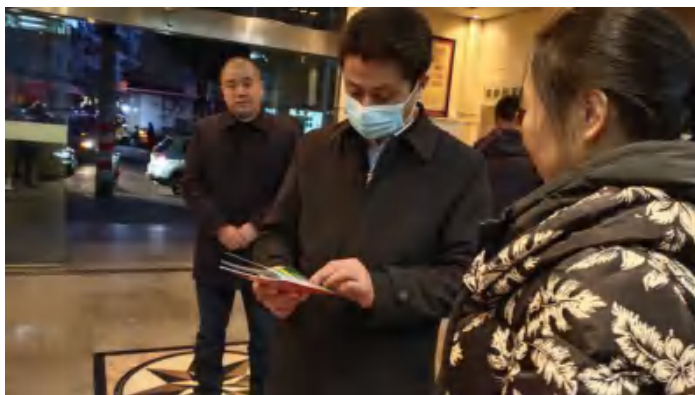
(广元市利州区疾控中心重传科 黄敏)