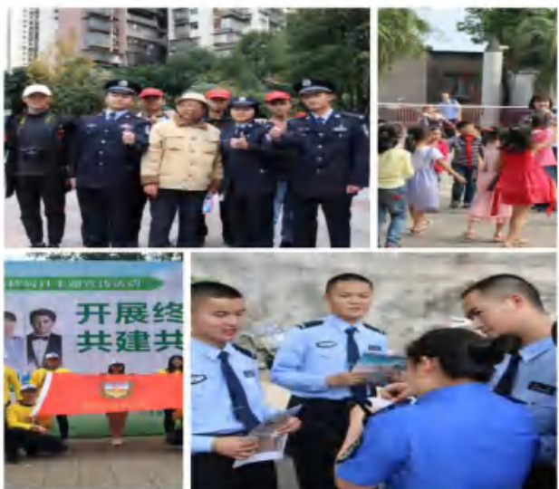
四川警察学院青年志愿者警务健康服务中心团队活动图集

四川警察学院青年志愿者警务健康服务中心团队警务健康服务中心下设有三个部门，它们分别是秘书部、文宣部、活动部。各部门紧密配合，自主开展多次血车进校园活动，并配合泸州市献血办、泸州市疾病预防控制中心、江阳区疾病预防控制中心进行校内外献血知识宣讲、艾滋病、结核病等传染性疾病预防等宣传的活动，现如今警务健康服务中心以结核病宣传、艾滋病宣传以及血车进校园活动为主，同时也积极开展有关各种健康知识的宣传。成绩突出，荣获2016、2019年度国家级优秀团队称号。