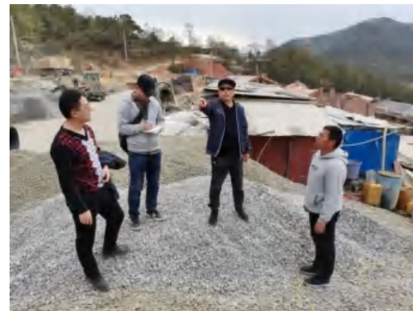
(内江市疾控中心 于雪岚)