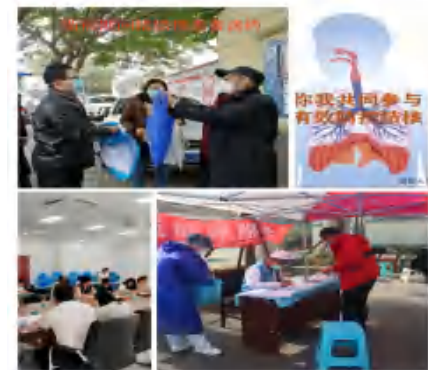
龙泉驿区结防宣传小分队活动图集

龙泉驿区结防宣传小分队由成都大学基础医学院学生、教师及医务工作者组成。2020年，团队充分利用网络，多次在抖音上发布宣传视频、在微博、微信、QQ群及学院网站上开展宣传。深入社区、工地、工厂、企事业单位、学校及景点、广场、地铁、火车站等人流量的地方通过发放结核病宣传资料、举宣传牌、面对面讲解结核问题等方式来让更多的人对结核病有更清楚的认识和了解。主要开展结防宣传活动120次，创作宣传歌曲1首，抖音小视频3份。其中，社区行活动覆盖人群8000余人，学校活动覆盖约2000人，网络宣传覆盖人群10000余人。龙泉电视台和报纸对志愿者的宣传活动也进行了报道，进一步增强了居民对结核病的认知度。获2020年国家优秀团队称号。