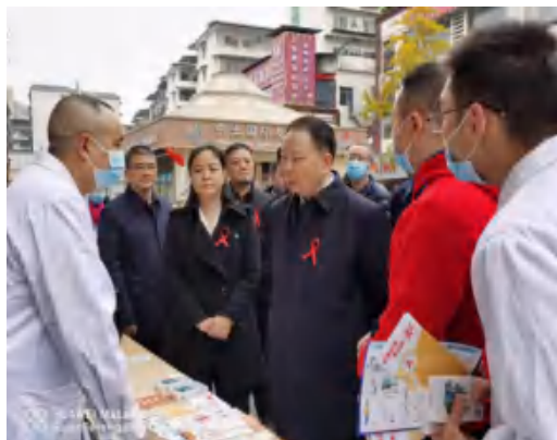
12月1日，遂宁市委副书记、市长邓正权出席遂宁市宣传活动，到市疾控中心现场咨询点了解相关工作，慰问工作人员。