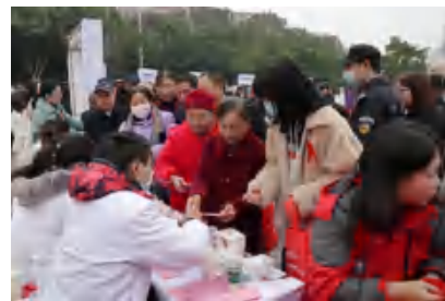
图5：12月1日，广安市思源广场主题宣传活动现场，市疾控中心工作人员为群众免费义诊，检测，发放宣传册，提供专业咨询服务。