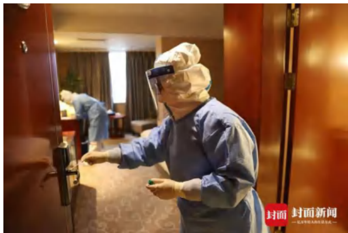
2月4日，四川省应对新冠肺炎疫情应急演练现场某离酒店环境采样。