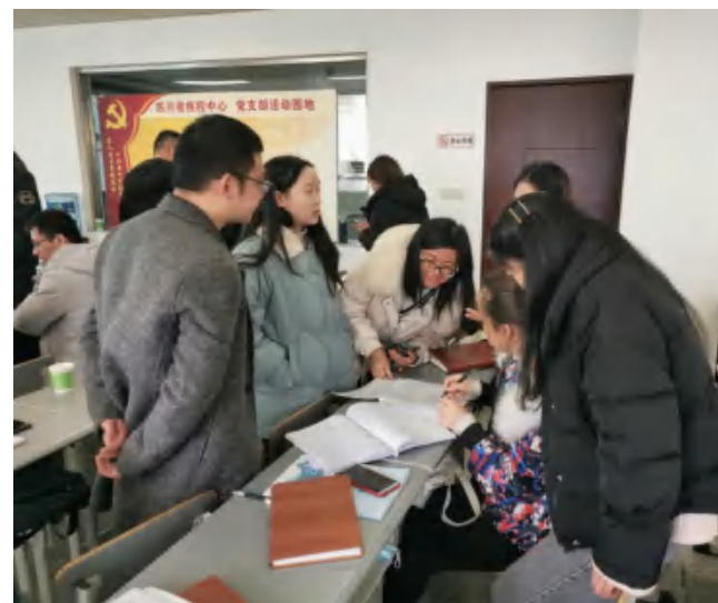
（省疾控中心科培处）

在这一个多月的理论学习中，全体学员们始终坚守疾控初心，严格自律，抓住机会，认真学习，都觉得本次培训通过温故知新以及理论与实际相结合，更学有所获。纷纷表示在今后的工作学习中一定初心不改，践行疾控使命，并坚信在进一步夯实理论知识的基础上，再通过后期的现场实践，在今后的工作中一定会发光出彩，尤其是在当前成都突发本地新冠肺炎疫情时，时刻为战疫而准备着。