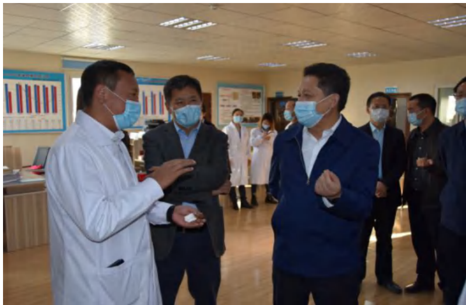
图 省人民政府副省长杨兴平一行在凉山州疾控中心调研艾滋病防治工作，听取了项目推进情况及未来发展规划，与国家性艾中心驻凉山州工作站工作人员进行了亲切交流。

杨兴平副省长对凉山州艾滋病防治工作给予了充分肯定，并对下一步工作提出要求：一是进一步精准扩大检测，避免重复检测；二是加强新发现病例的溯源追踪，提高检测效率；三是深化基层医疗卫生机构和社会组织协作工作模式，确保治疗覆盖面和效果；四是继续推进“艾青春”行动，有效降低青少年感染风险。