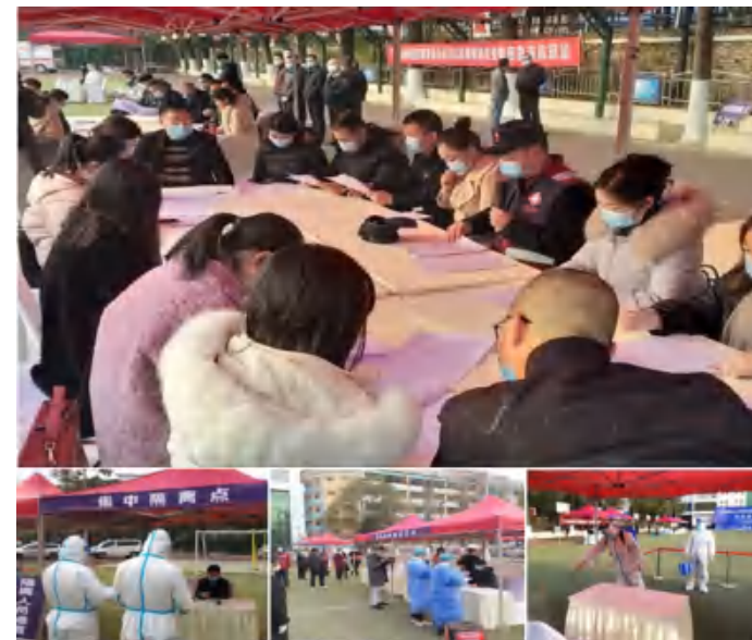
图 2月7日，利州区金城华府小区演练现场点