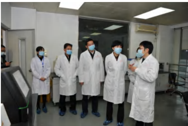
图 省卫生健康委党组书记敬静调研中心微生物实验室

站在“十四五”起点，省疾控将认真实施《四川省疾病防控救治能力提升三年行动方案（2020—2022年）》，推动成渝地区双城经济圈疾控工作协同发展，改革完善人才队伍体系建设，为“健康四川”建设贡献疾控力量。