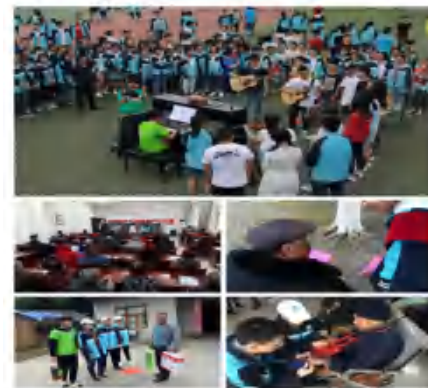
健康伴我行志愿者团队活动图集

动，积累了丰富的经验，并于2017年申请并参与到“百千万志愿者结核病防治知识传播行动中”，开展活动共计16种32余次，取得了良好的社会效益，荣获2017年国家优秀团队称号。