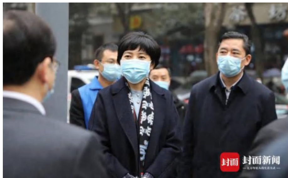
2月4日，省应对新冠肺炎疫情应急指挥部副指挥长、疫情防控组组长、省卫生健康委党组书记敬静，省卫生健康委党组成员、副主任、一级巡视员宋世贵带队赴应急演练疫情防控一线开展处置工作。