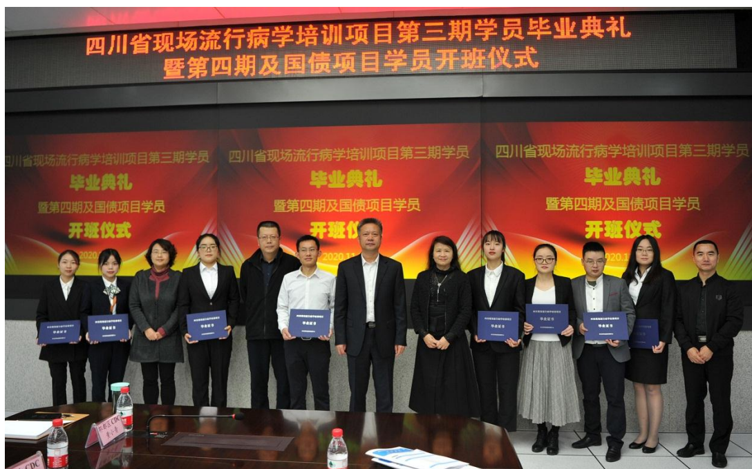
领导为毕业学员颁发毕业证书