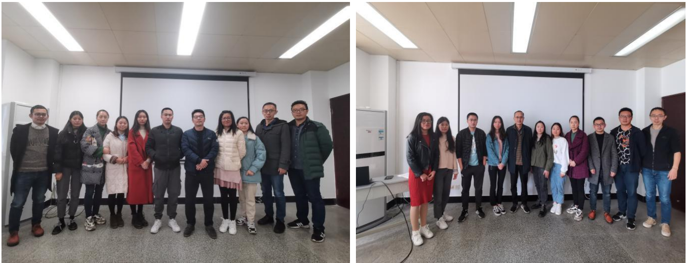
四川大学公共卫生学院老师与 SCFETP-4 学员合影

两个月理论学习已经结束，即将迎来十个月的现场实践，我们在后续的实践学习中将守公共卫生事业初心，担疾控人使命，贯彻“干中学”理念，秉承“敬业、团队、探索、求实”四大精神，提升“应急调查、救灾防病、疾病监测”等八大能力，使自己早日成为一名优秀的现场流行病学专业人才。